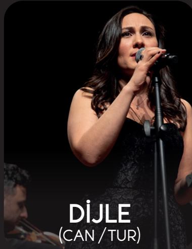
DİJLE (CAN / TUR)