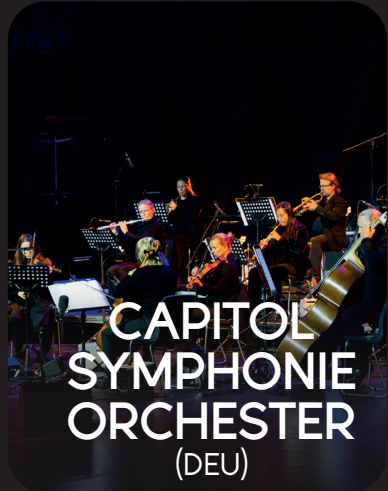
CAPITOL SYMPHONIE ORCHESTER (DEU)